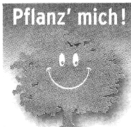
Eine Aktion von FIELMANN und der Westdeutschen Zeitung

Düsseldorf. Liebevoll gebastelte Gärten im Schuhkarton und auf Rigips-Platten, tolle Videofilme mit selbst gedichteten Raps und Kinderliedern, riesige Plakate und Foto-Colagen: Die Jury der Pflanz' mich-Aktion von Westdeutscher Zeitung und Fielmann war bei weit über 100 kreativen Bewerbungen aus unserem Verbreitungsgebiet lange beschäftigt, um die 33 Besten auszuwählen.